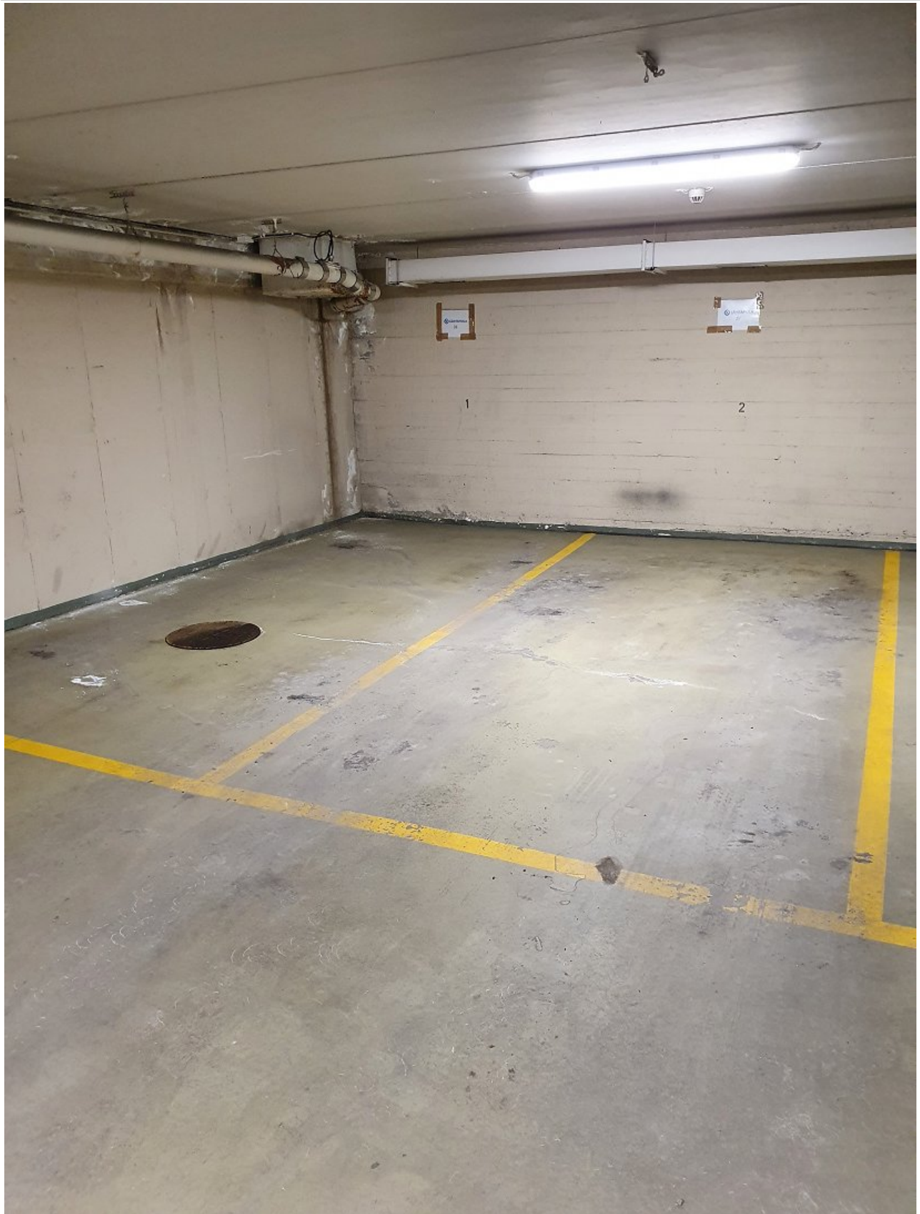
Esimerkkikuva vuokrattavasta parkkipaikasta.