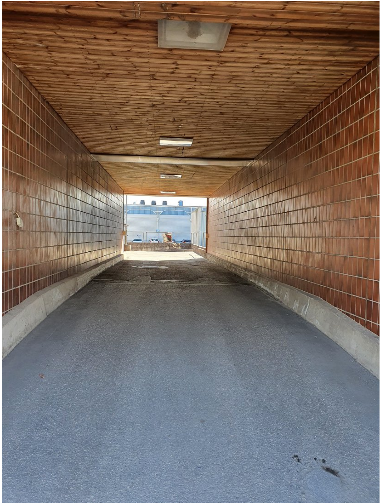
Käynti Annankadulta porttikongista.